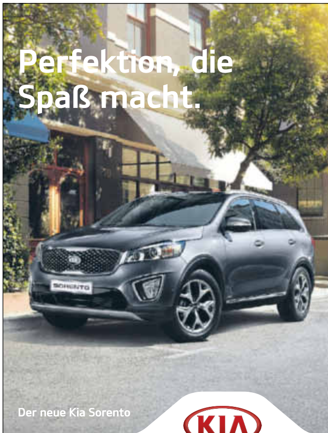
Der neue Kia Sorento