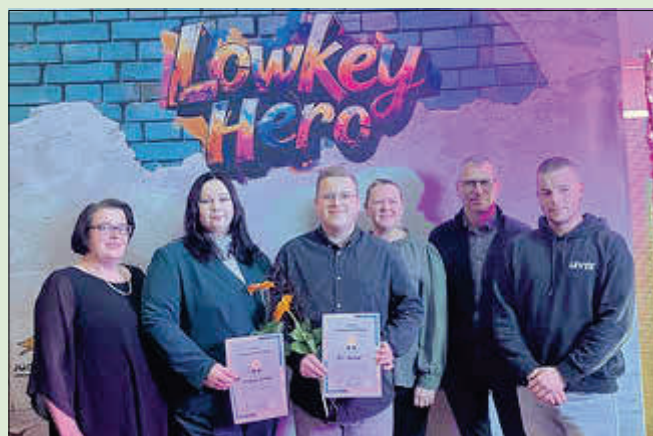
- Preisverleihung „Junges Ehrenamt“

Den Artikel zu den Fotos finden Sie auf Seite 12.