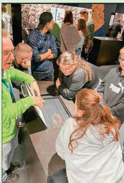
Jugendbildungsfahrt - DDR Museum Foto: Dörte Schmidt