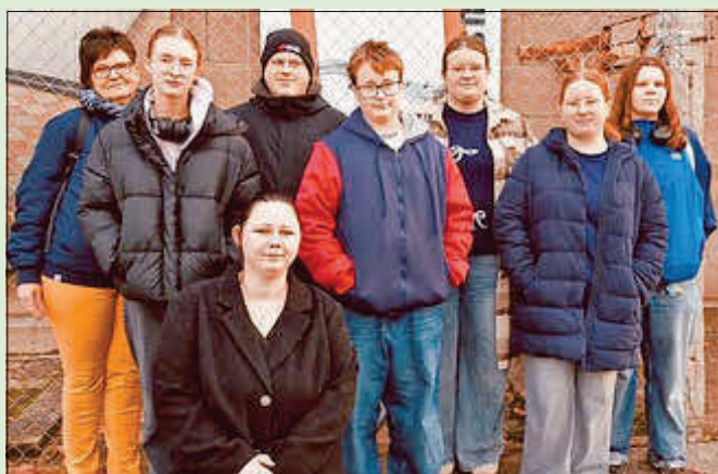
Jugendbildungsfahrt Gedenkstätte Hohenschönhausen