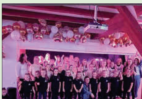
20 Jahre Sunshine

Im November war richtig viel los in der Jugendarbeit/ Jugendsozialarbeit vom Amt Güstrow -Land