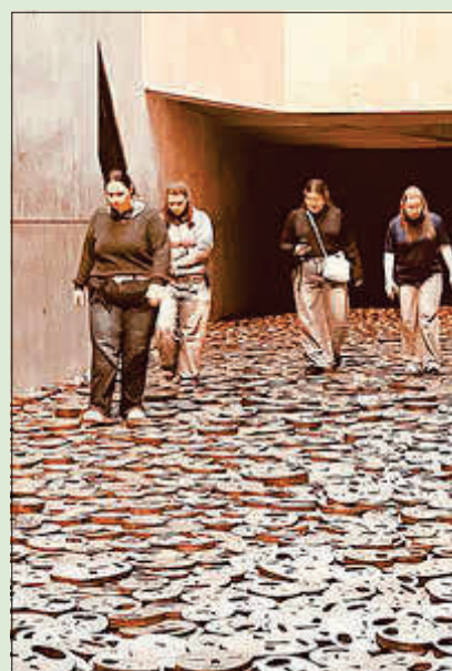
Jugendbildungsfahrt - jüdisches Museum

Im November war richtig viel los in der Jugendarbeit/ Jugendsozialarbeit vom Amt Güstrow -Land