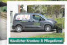
Klassischer Kranken- & Pflegedienst