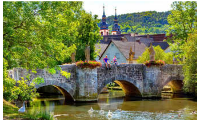
An der Barockbrücke in Gerlachsheim macht das Liebliche Taubertal seinem Namen alle Ehre.

(djd). Eine Wanderung durchs Liebliche Taubertal führt durch eine idyllische Flusslandschaft mit malerischen Fachwerkstädten, historischen Burgen, Weinbergen und Wäldern. Sie fühlt sich aber nicht immer nur lieblich an. Denn wer die schönen Aussichten am Panoramaweg Taubertal genießen möchte, muss auch die Anstiege bewältigen. Das lohnt sich auf jeder der fünf Etappen zwischen Rothenburg ob der Tauber und Freudenberg am Main, denn sie richten die Aufmerksamkeit der Urlauber gezielt auf die Sehenswürdigkeiten der Region: "Durchs Tal der Mühlen" lautet das Motto des ersten Abschnitts, der vom mittelalterlichen Rothenburg ob der Tauber meist am Fluss entlang nach Creglingen führt. "Schlösser, Wald und Wein" heißt die zweite Etappe nach Bad Mergentheim mit dem imposanten Residenzschloss. "Zu Bocksbeutel und Madonnen" geht es weiter