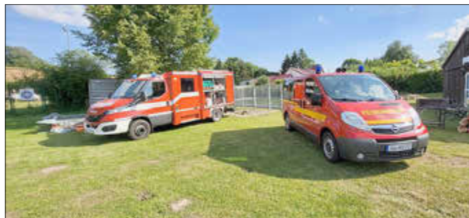
Zwei neue Fahrzeuge der FFW Klein Upahl