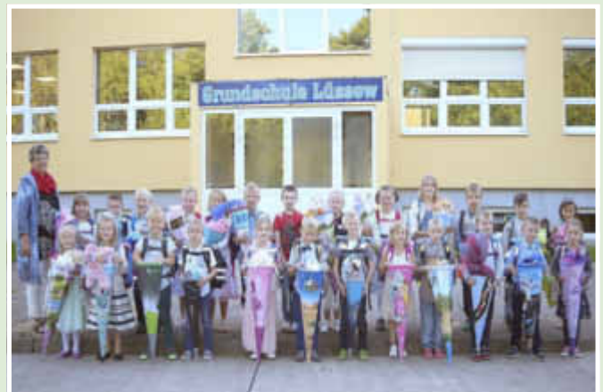
Klasse 1 Lüssow