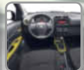
Abbildung *** zeigt Sonderausstattung.

Nur für kurze Zeit in den Trendfarben der Saison: Karambola-Gelb oder Pitaya-Violett: