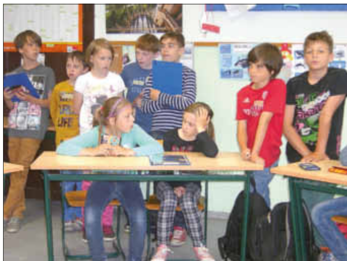
Klasse 4 denkt über umweltschonendes Einkaufen nach.