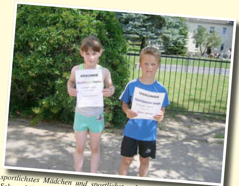
sportlichstes Mädchen und sportlichster Junge der Grundschule am Schmooksberg