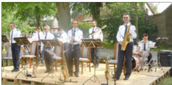
Dixieland-Jazz-Band des Landespolizeiorchesters

Sackhüpfen und Eierlauf fanden im Außenbereich statt. Und natürlich wurden die Hüpfburg und das neue Karussell intensiv genutzt. Kleine Preise für die Teilnehmer sorgten für zusätzliche Begeisterung.