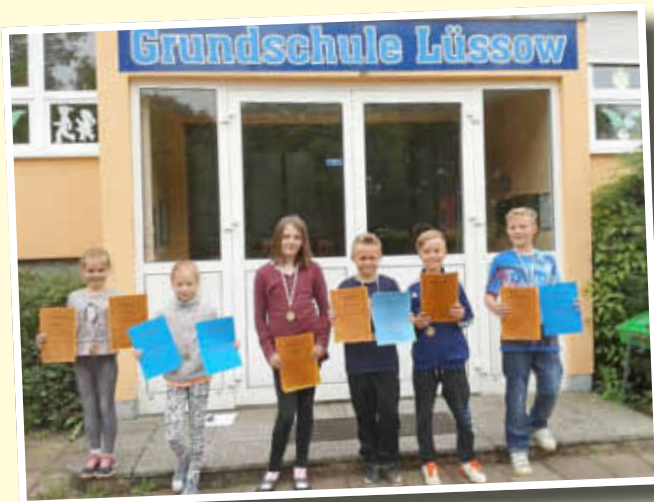
Schulsieger beim Dreikampf der Grundschule Lüssow