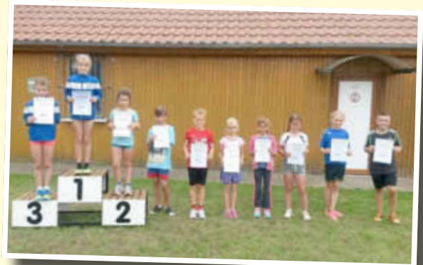
Grundschulsieger der Regionale Schule Zehna mit Grundschule