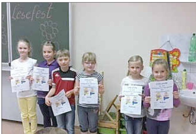
Gewinner der 1. und 2. Klasse, Foto: Annette Dittmeyer

Alle Gewinner haben sich über ihre Urkunde und ein neues Buch gefreut.