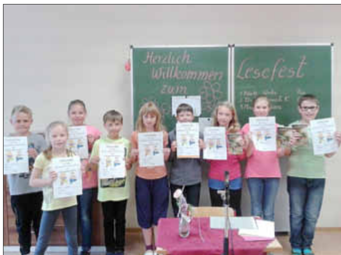
Gewinner der 3. und 4. Klassen