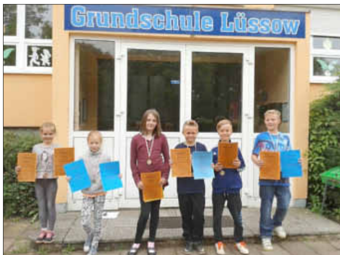
Schulsieger beim Dreikampf

Am Tag darauf fand das Sportfest statt. Beim Dreikampf wurde mit viel Ehrgeiz um die besten Leistungen gekämpft. Ermittelt wurden die Besten in den einzelnen Disziplinen, die Klassensieger sowie die Schulsieger. Anschließend nahmen die Kinder die Hüpfburg und verschiedene Spielgeräte des Sportmobils in Beschlag. Eine Stärkung gab es am Imbisswagen. Wir sagen allen ein großes Dankeschön, die uns an diesem Tag unterstützt haben.