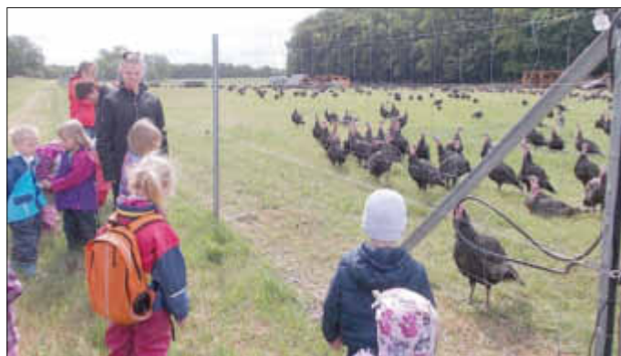
Die Puten in Dehmen