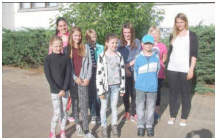
Die Redakteure der Bärenatze

In den letzten Wochen gab es viele Gründe, sich zu freuen.