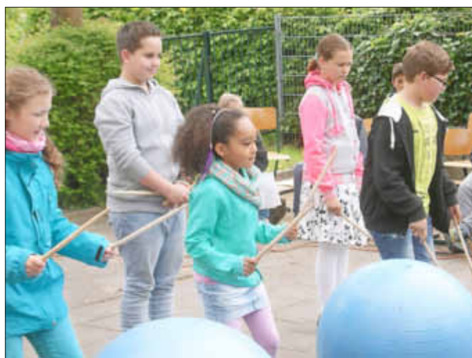
Choreografie mit Drums

Am Sonnabend, dem 30.05.2015 hieß es in der „Grundschule am Schmooksberg“ in Diekhof wieder „Tag der offenen Tür“. Petrus hatte Punkt 9:00 Uhr ein Einsehen mit uns und schickte den Regen fort, so dass der Vormittag wie geplant ablaufen konnte. Eltern, Großeltern und alle interessierten Verwandten waren gekommen, um sich ein abwechslungsreiches Programm anzusehen, an dem alle Schüler der Klassen 1 - 4 beteiligt waren.