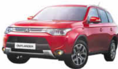
Abb. zeigt Ausstattungsvariante TOP ***

DER MITSUBISHI OUTLANDER GROSS IN MODE. KLEIN IM PREIS. Stilvoller Freiraum für die ganze Familie.