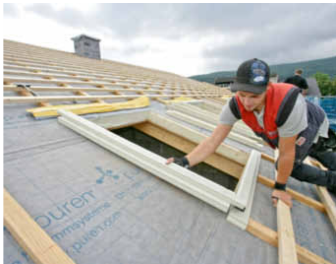
Kommen spezielle Dämmzargen für den Einbau der Dachfenster zum Einsatz, bleibt das Dach auch hier wärmebrückenfrei.

(djd). In der Altbauanierung lohnt es sich, auf typische Problemzonen zu achten, an denen Wärmebrücken entstehen können. Dazu gehören zum Beispiel im Bodenbereich Sockel ohne Perimeterdämmung, an der Fassade Balkon- und Terrassenanschlüsse oder angebaute Garagen, die thermisch mit