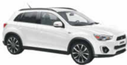
Abb. zeigt ASX Klassik Kollection+ 1.8 Di-D+ 2WD

SO VIEL ANZIEHUNGSKRAFT VERDIENT EINEN GUTEN PREIS.