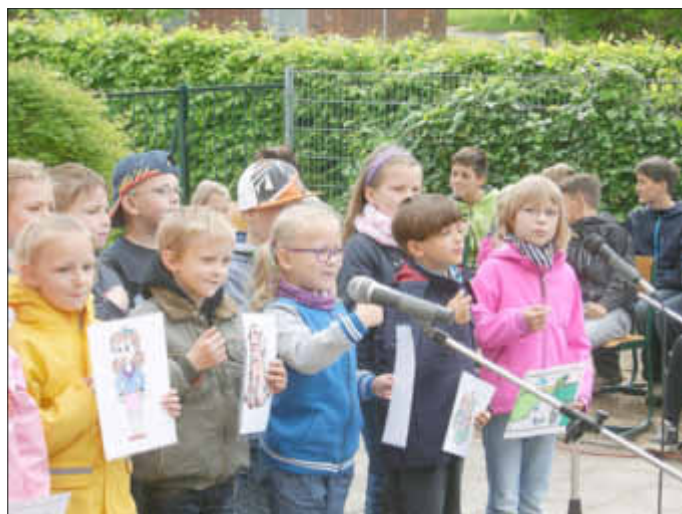
Kinder der 1. Klasse singen ein Lied.

Besondere Höhepunkte stellten Choreographien mit Drums und Bechern dar.