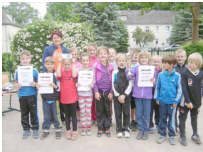
Sportlichste Klasse mit Wanderpokal - Klasse 1

Aufregung herrschte wieder vor Beginn des diesjährigen Sportfestes am 16.06.2015. Voller Eifer und Elan starteten alle Klassen nach der Erwärmung mit dem Dreikampf, denn es ging darum Urkunden, Preise und als höchste Belohnung den Wanderpokal, zu erkämpfen.