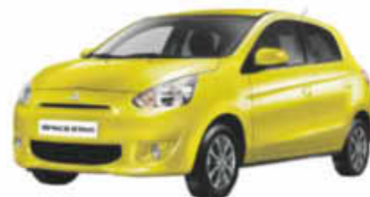
Abb. zeigt Space Star Klassik Kollection+ 1.2 MIVEC CVT

*** Outlander Gesamtverbrauch (l/100 km) kombiniert 6,9 - 8,1; CO 2 -Emission kombiniert 150 - 134 g/km, Effizienzklasse D - B.