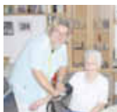
In guten Händen

BETREUTE WOHN- GEMEINSCHAFT im SENIORENLANDSITZ