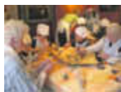
Bewohner so betreuen, wie man es selbst gern hätte