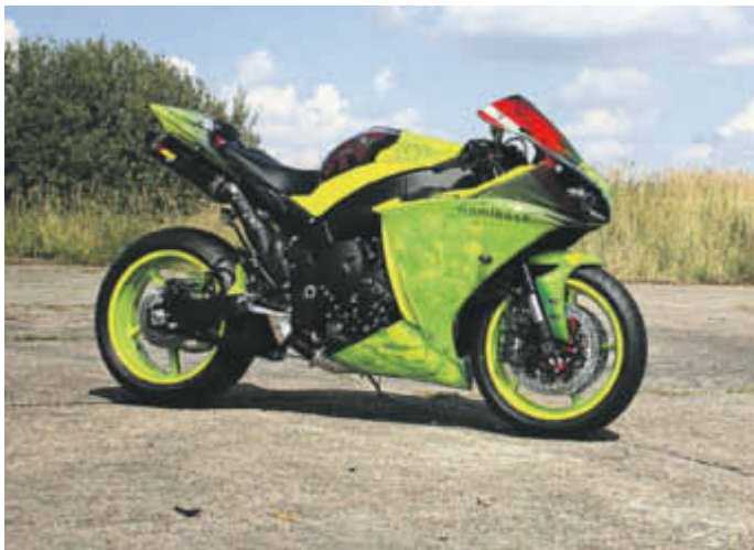
Blitzblank und in einem Top-Zustand - so kann die nächste Motorradsaison starten.

Eine gute Idee zu Weihnachten! Geschenkgutscheine von Zweirad Hassemer.