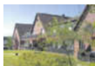
Rundum gut versorgt

BETREUTE WOHN- GEMEINSCHAFT im SENIORENLANDSITZ