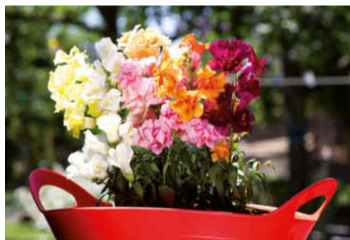
Fröhliche Stimmung verbreiten die kunterbunten Blüten der Löwenmäulchen-Mischung "Twinny Mix".

akz-o Kunterbunter Blütenzauber ist mit den neuen gefüllten Löwenmäulchen (lateinischer Name "Antirrhinum majus") "Twinny Mix" garantiert. Fast das gesamte Farbspektrum wird abgedeckt durch Töne wie hell- und dunkelrosa, scharlachrot, orange, gelb und reinweiß bis hin zu bronze. Die einjährigen Pflanzen bilden kurze, kräftig-grüne und reichlich verzweigte Stiele,